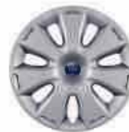
Tapacubos de 16" y 7x2 radios (De serie en Trend)

Se ha creado una gama exclusiva de elegantes llantas de aleación como complemento para la nueva línea dinámica del Ford Focus.