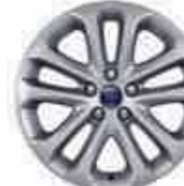
Llanta de aleación de 17" y 5x2 radios (Accesorio) Nº de pieza 1710606