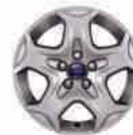
Llanta de diseño de 16" y 5 radios (Accesorio)