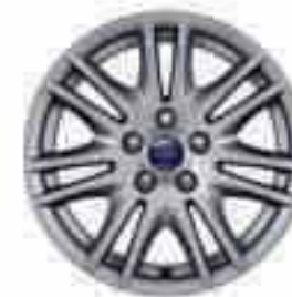
Llanta de aleación de 16" y 7x2 radios (Accesorio) Nº de pieza 1710604