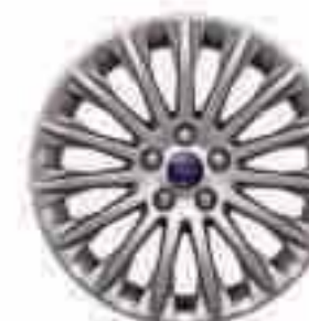
Llanta de aleación de 17" y 15 radios (Opción y accesorio) Nº de pieza 1719527