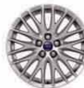
Llanta de aleación de 17" y 10x2 radios (De serie en Trend Sport, accesorio en las demás versiones) Número de pieza 1719524