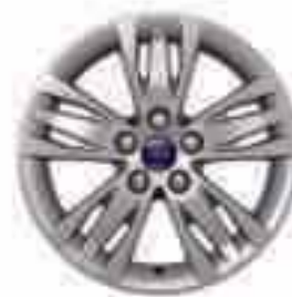
Llanta de aleación de 16" y 5x3 radios (Opción y accesorio) Nº de pieza 1715342