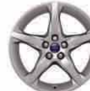
Llanta de aleación de 18" y 5 radios (Opción y accesorio) Nº de pieza 1719526