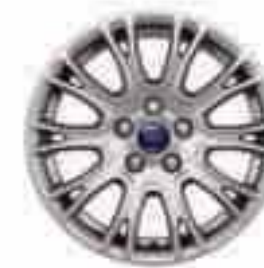
Llanta de aleación de 16" y 10x2 radios (De serie en Titanium, accesorio en las demás versiones) Nº de pieza 1715343