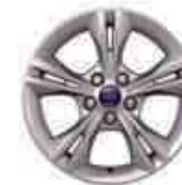
Llanta de aleación de 16" y 5x2 radios (Accesorio) Nº de pieza 1715341