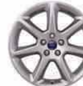
Llanta de aleación de 18" y 7 radios (Accesorio) Nº de pieza 1702126

La versión que se muestra es un Ford Focus Titanium con pintura metalizada Rojo Eléctrico (opción) y llantas de aleación de 18" y 5 radios (opción y accesorio).